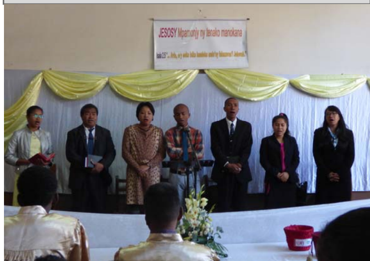
Sabata 06 may: Sabatan'ny Fifandraisana. "ary izay mamerina ny maro ho amin'ny fahamarinana dia ho tahaka ny kitana mandrakizay doria."Dan. 12:3 Natao hamerenana ny maro ho amin'ny fahamarinana ireo teknolojia sy fandrosoana ankehitriny.