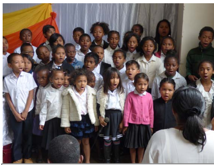
Fetin'ny Reny, sy fetin'ny Ray: samy nankalazaina avokoa . Ny sampana miadidy ny ankizy no nanomana sy nikarakara. Ny zanaka ho tia ray aman-dreny, ary ny ray aman-dreny ho tia zanaka. Ka ho tokantrano sambatra ny tokantrano rehetra.