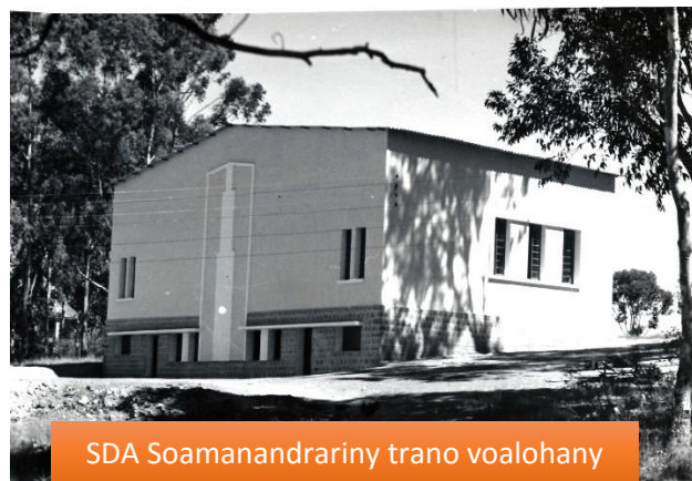
SDA Soamanandrarin'ny trano voalohany

Ny 21 sy 22 Mai 1955 no fotoana nitokanana ny tapany voalohany tamin'ny trano fiangonana teto Soamanandrarin'ny.