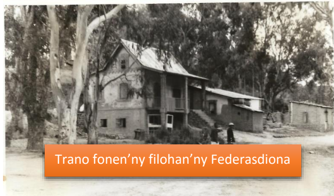
Trano fonen'ny filohan'ny Federasidiona

Ity no trano nandraisana azy mianakavy tamin'izany fotoana izany.