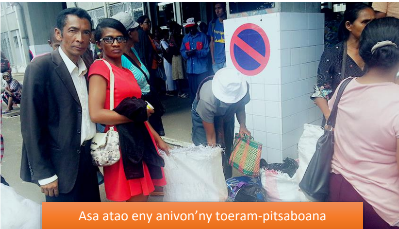
Asa atao eny anivon'ny toeram-pitsaboana

hanala fahasahiranana ireo ray amandreny manana zanaka marary teny amin'ny "maternité" Befelatanana ny Fiangonana Advantista Mandrosoa sy ireo mpino Advantista maro tamin'io.