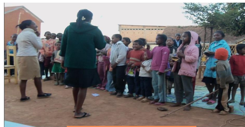
Konferansa tao Ankadimanga

isan'andro no tonga nianatra ny Soratra Masina. Ireo mpampielany Boky Evanjelista avy ao Moramanga no niaranisalahy tamin'ny fanatanterahana ity kaonferansa fitoriana ny filazantsara ity. Mitohy ny fianaran'ireo olona liana ny Soratra Masina ary miandry ny fotoana izay hanatanterahana ny batisa. Hisokatra tsy ho ela ny fiangonana advantista ao Ambodiakondro.