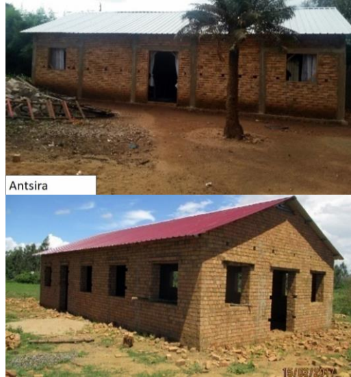
Mahasolo Distrika Ankadinondry, Antanifotsy Distrika Tanambe, Mantasoa Distrika

Ny 3 janoary 2017 no Tonga teto Antananarivo ny teknisiana amin'ny fananganana ny fiangonana vita indray andro. Ny 9 janoary no nanomboka ny fanorenana ny fiangonana. Ny fiangonana Ambatolampy ao anatin'ny Distrika Ambohidroa no nanombohana izany. Enina mirahalahy no ekipa miaraka amin'ilay vahiny izay manofana azy ireo amin'izany fananganana izany. Ireto avy ny fiangonana nahazo « one day church » : Ambatolampy Distrika Ambohidroa, Ankazo Distrika Mahitsy, Ambohitsoa Distrika Soavinimerina, Andranofeno Distrika Ankazobe I, Anjzorobe, Antanivao Distrika Tsarasaotra, Antsira Distrika Ambohibary,