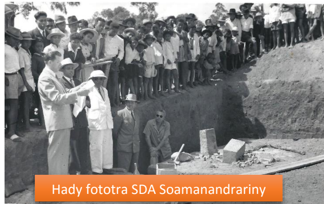
Hady fototra SDA Soamanandrarin'ny

Ny taom-pianarana 1954 no nanombohana ny fanorenana ny trano fiangonana lehibe izay ahafahan'ireo mpianatra manodidina ny 500 tamin'izany fotoana izany hivavahana.